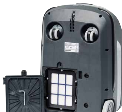
HEPA H13-Abluftfilter ist Standard bei allen Varianten des VP600 Battery