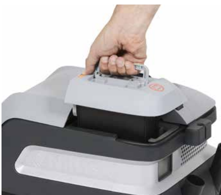
Leicht zugängliche Batterie macht das Aufladen schnell und einfach