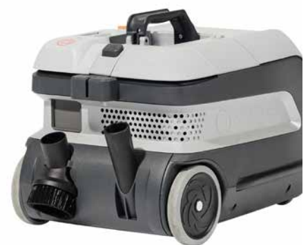
Benutzerfreundliches und leicht erreichbares Zubehör