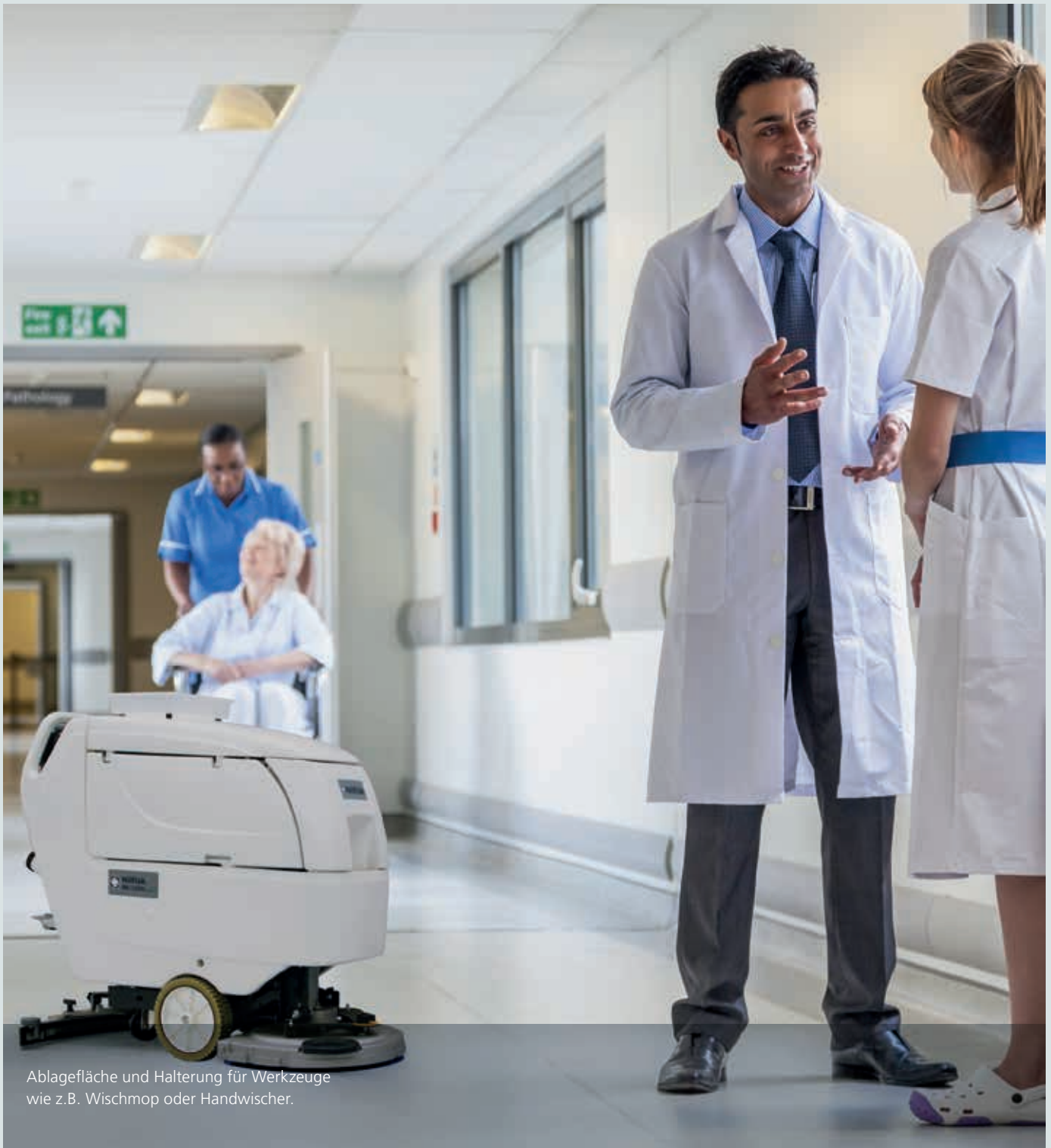
Ablagefläche und Halterung für Werkzeuge wie z.B. Wischmop oder Handwischer.