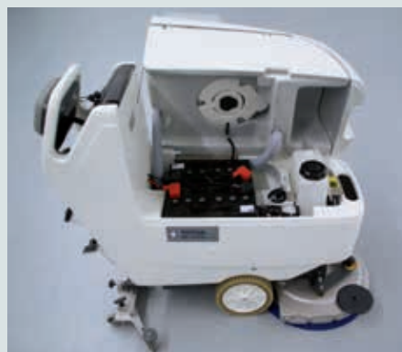
Alle technischen Komponenten sind leicht zugänglich. Einfache Befüllung des Ecoflex™-Systems. Extra geräuschkämmend für leise Anwendungen.