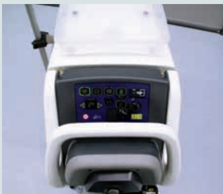
“One Touch“-Bedienung für alle Schubb-/Saugfunktionen.