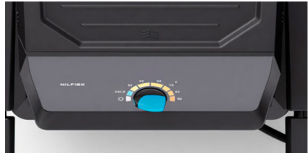
Advanced Modelle MH35-45-55-65-75-85